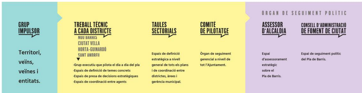
Figura 1. Instàncies organitzatives que intervenen en el desenvolupament del Pla de Barris (2016-2024).