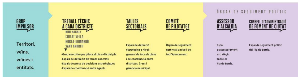
Figura 1. Instàncies organitzatives que intervenen en el desenvolupament del Pla de Barris (2016-2024).